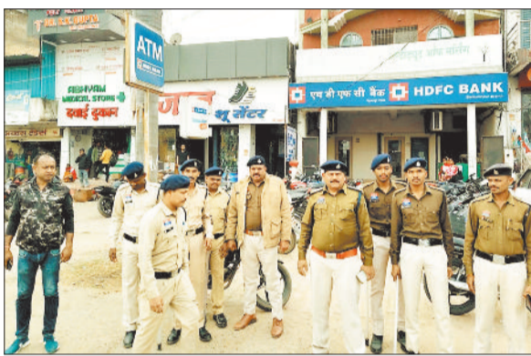
निरीक्षण करते पुलिस अधिकारी